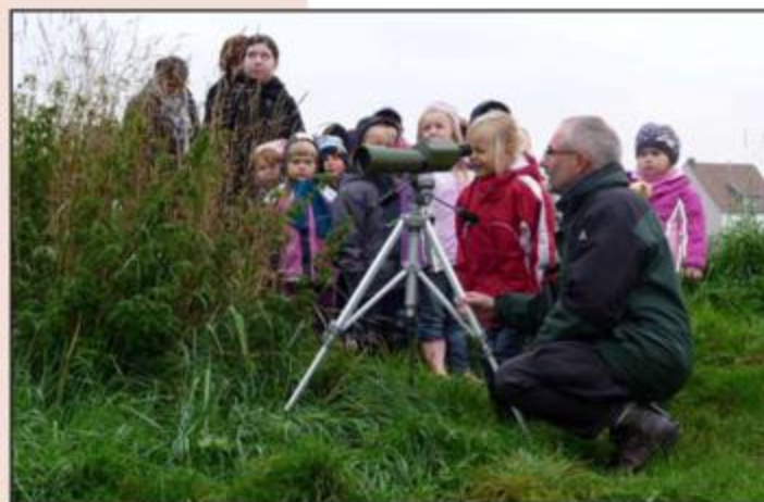
Abb. 108: Spannend war der Blick durchs Spektiv