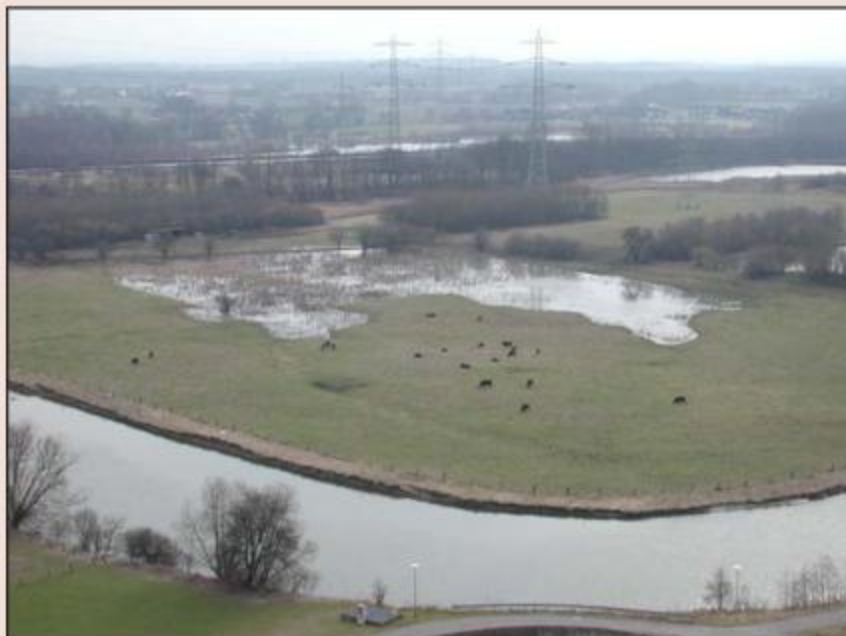
Abb. 102: Blick auf die Heckrind-Projektflächen am Gerstein-Kraftwerk bei Werne-Stockum

In den letzten Jahrzehnten ist es – nicht zuletzt in finanzieller Hinsicht – immer schwieriger geworden, dieses Bemühen in die Tat umzusetzen. Vor diesem Hintergrund hat ein Paradigmenwechsel im Naturschutz stattgefunden. Insbesondere in Landschaftsbereichen, wo sich die Landwirtschaft zurückzieht oder große Renaturierungsvorhaben (z. B. Wiedervernässung der Aue) die landwirtschaftliche Bewirtschaftung stark einschränken, werden mit „großen Pflanzenfressern“ – wie den Heckrindern – sogenannte Naturentwicklungsgebiete initiiert. Der naturschutzfachliche Hintergrund hierzu (Großherbivoren-Theorie) wurde im Naturreport bereits an anderer Stelle erläutert (KLINGER 2004). Landschaftsentwicklung findet in Naturentwicklungsgebieten im wesentlichen durch die Sukzession der Vegetation im Zusammenspiel mit den Aktivitäten der in geringer Anzahl (ca. 1 Tier pro 4 ha) eingesetzten Tiere, die dort ganzjährig leben, sowie – in Auen – im Zusammenspiel mit der Fließ- und Überflutungsdynamik des Fließgewässers statt. Andere landschaftsgestaltende bzw. -pflegerische Eingriffe werden nicht mehr (oder nur sehr selektiv) vorgenommen. Heckrind-Projekte haben somit nichts mit herkömmlicher, landwirtschaftlich betriebener Beweidung zu tun. Naturentwicklungsgebiete können so vielfältige Vegetationsstrukturen aufweisen und inmitten einer intensiv genutzten Kulturlandschaft als wertvoller Rückzugs- und Lebensraum dienen.