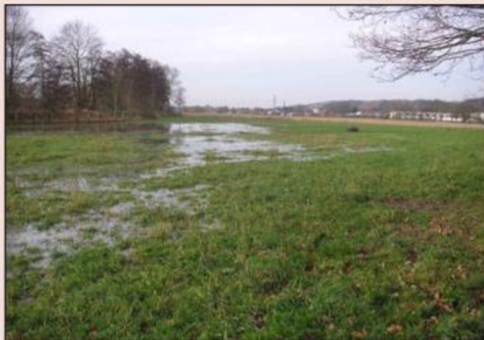
Abb. 106: Beginnende Auenvernässung, erste Rinnestrukturen werden sichtbar

Um dies zu erreichen, wurde durch den Kreis Unna im November 2010 im Mündungsbereich des Rrammbachs in die Ruhr ein Flößgraben reaktiviert und teilweise neu angelegt. Dieser ermöglicht es, Wasser aus dem Rrammbach-Ruhr-System in die Kiebitzwiese einzuleiten und die teilweise unter Ruhrwasserspiegel liegenden Flächen des Naturschutzgebietes zu bespannen. Insbesondere bei Hochwasserereignissen ist damit wieder eine für Auenflächen typische Überflutungsdynamik in der Kiebitzwiese gegeben, die seit fast 100 Jahren durch den Bau des Wehres und der Ruhrverwaltung unterbrochen war.