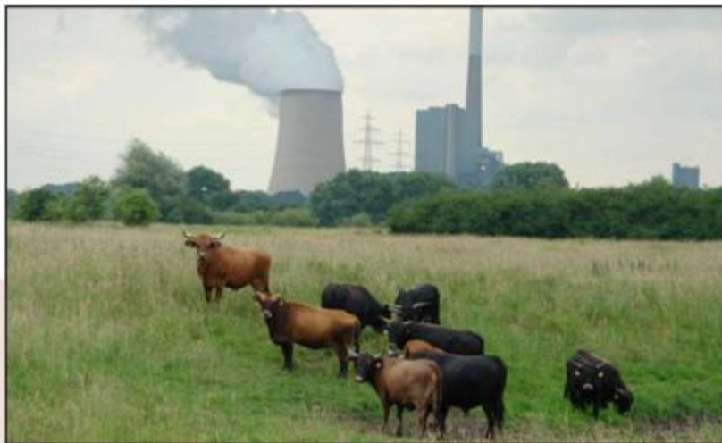
Abb. 103: Blick auf die Projektfläche bei Werne-Langern, im Hintergrund das Kraftwerk Heil