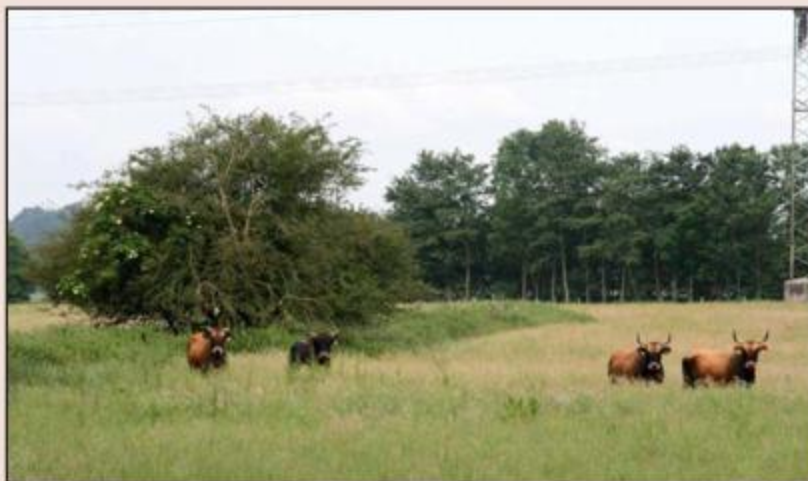
Abb. 104: Blick auf die Projektfläche bei Fröndenberg-Westick