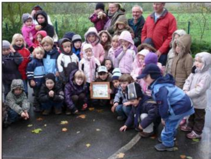
Abb. 109: Im Rahmen einer kleinen Feier wurde der Name für das kleine Kalb bekannt gegeben . . .