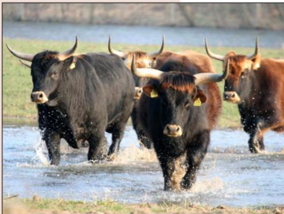
Abb. 101: Nur die Ohrmarken stören - Heckrinder auf der Kiebitzwiese in Fröndenberg

Der Naturschutz versucht zum einen, die Fließgewässer durch redynamisierende Renaturierungsmaßnahmen zu „reparieren“. Zum anderen war er zurückliegend bemüht, die in den Auen vorhandene Kulturlandschaft zu erhalten bzw. zu extensivieren, was ihre landwirtschaftliche Bewirtschaftungsformen angeht also „zurück zu entwickeln“.