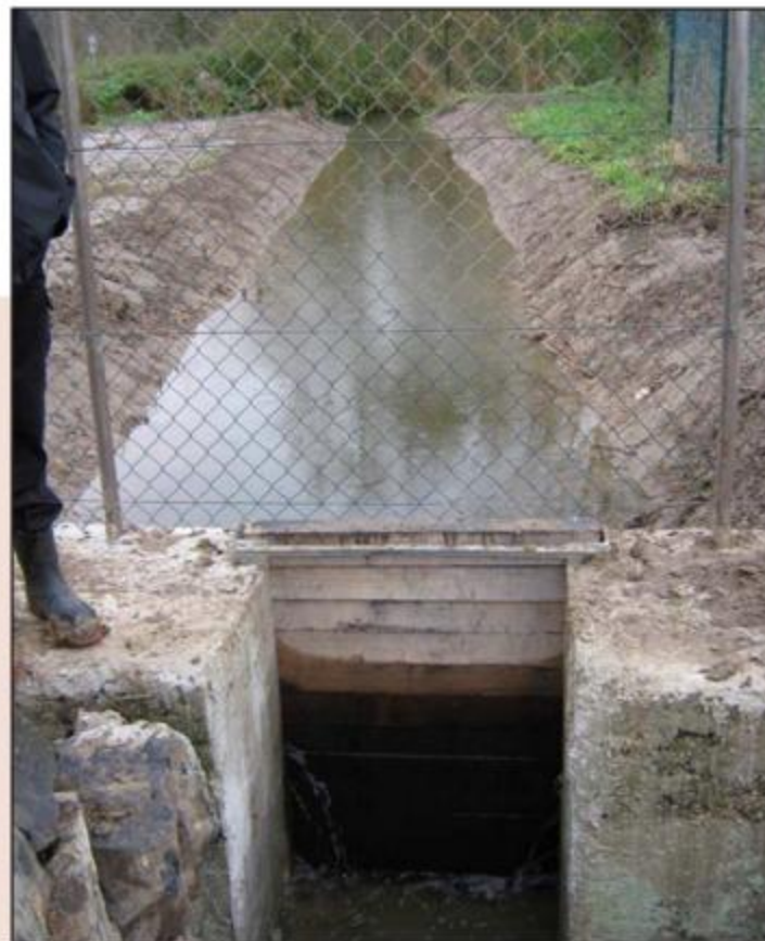
Abb. 105: Neuer Flößgrabenabschnitt mit Einlaufbauwerk zwischen dem Rrammbach und der Kiebitzwiese

Zusätzlich werden im Gelände vorhandene Gerinnestrukturen vertieft werden. Durch den höheren Bodenwassergehalt und die jetzt deutlich extensivierte Beweidungsintensität ist der Wandel in der Vegetation hin zu feuchten und nassen Wiesen- und Gehölzstrukturen absehbar. Die ersten rasenden Bekassinen und Bergpieper künden bereits von der Wiederherstellung der typischen Auenlandschaft.