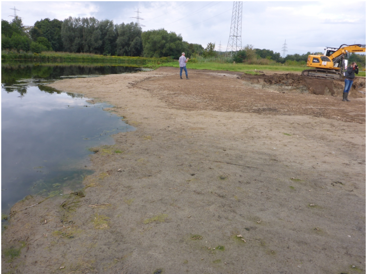
Weite Teile des neu geformten Ufers sind sehr flach ausgeformt worden.