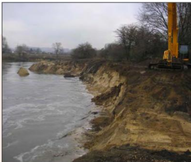
Abb. 78: Uferentfesselung des linken Lippeufers im nördlichen Bereich des ehemaligen NSG Zwiebfeld

Ein ausführlicher, erster Bericht wurde Ende 2010 erstellt. In einem Folgebericht wurde 2011 auf die Veränderungen im Bestand der zu betrachten-