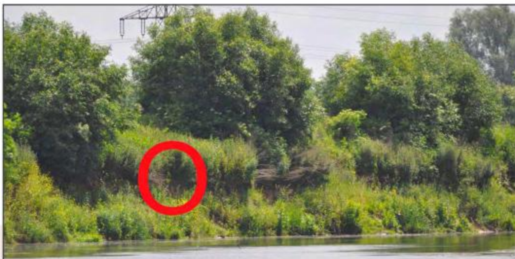
Abb. 80: Sechs besetzte Brutröhren (rot umrandet) in einer Steilwand am nördlichen Ufer des ehemaligen NSG Zwiebfeld in 2012