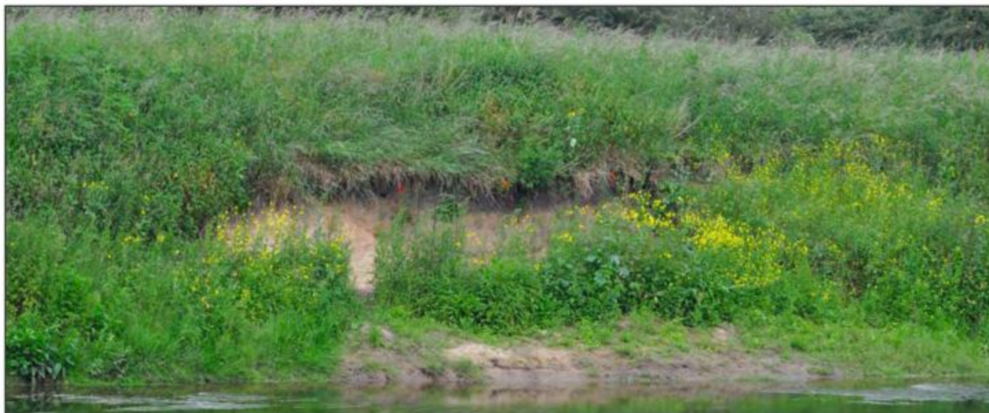
Abb. 81: Drei besetzte Brutröhren (rot umrandet) im Bereich des ehemaligen NSG Stocke am rechten Lippeufer in 2012